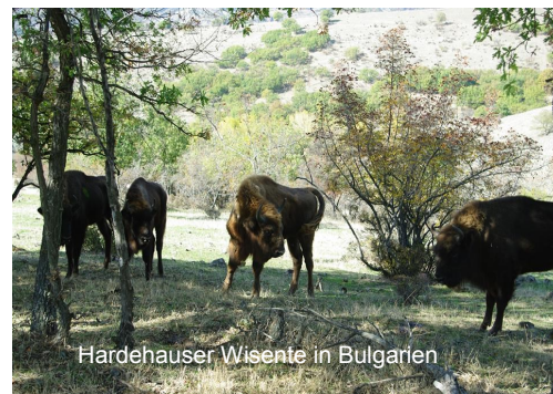
Hardehauser Wisente in Bulgarien

In der Municipality Momchilgrad im Distrikt Kardjali in Südbulgarien soll eine freilebende Wisent Herde etabliert werden. Nach umfangreichen Planungen war es dann am 24. Oktober soweit, vier junge Wisentkühe — „Eggerose“, „Egbertine“, „Egomandra“ und „Eggefée“ aus der Bergwisentherde wurden betäubt und in einen mit Stroh ausgepolsterten Transporter gebracht. Eine sowohl für die Tiere angenehme, als auch für die Mitarbeiter des Geheges ungefährliche Art der Verladung! Der Kuh „Egomandra“ wurde zusätzlich noch ein GPS-Halsband umgeschlallt, damit der Aufenthaltsort der neuen Herde in Bulgarien per Computer verfolgt werden kann. Die Wisente mussten allerdings noch durch insgesamt sechs Länder (Deutschland, Tschechien, Slowakei, Ungarn, Rumänien, Bulgarien) fahren, ehe sich am Sonntagmorgen die Laderampen in ihrem neuen Zuhause öffneten. Durch Unterstützung des bulgarischen Projektes konnte Wald und Holz NRW einen wesentlichen Beitrag zum Erhalt des letzten europäischen Wildrindes im Sinne der Biodiversität leisten.